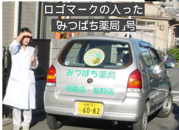
ロゴマークの入った 「みつばち薬局」号