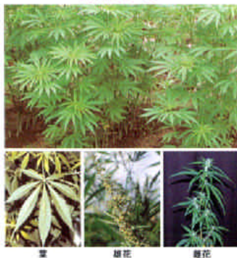
— 大麻(アサ) —