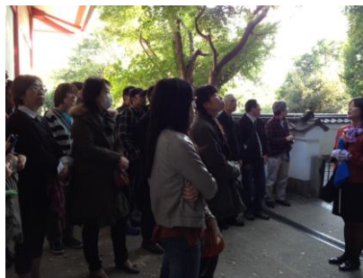
耳なし芳一堂の説明を真剣にきいてしまいました。