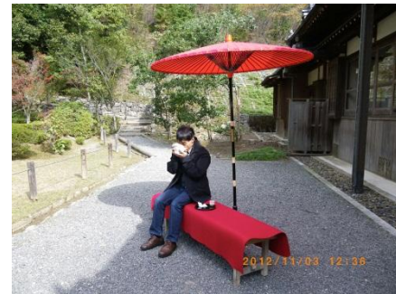
庭を鑑賞しながら一服、癒されます