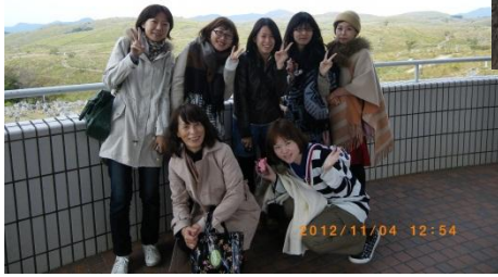
お嬢さんたち集合